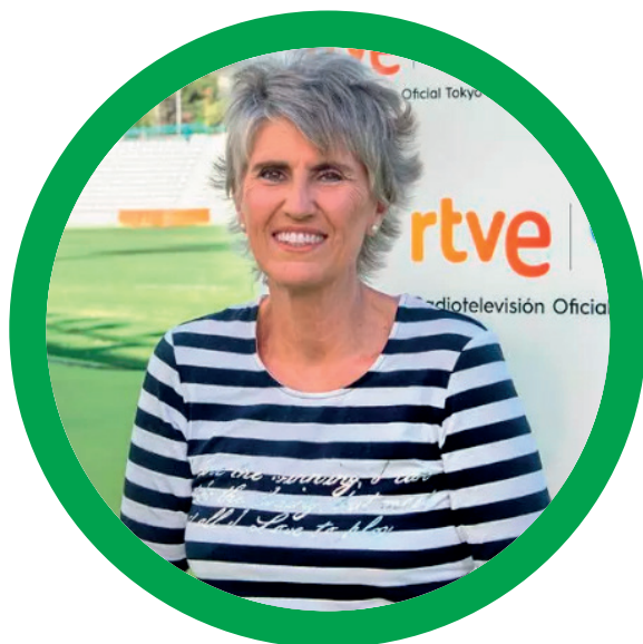
Paloma del Río

Una de las pioneras del periodismo deportivo, su voz claramente se identifica con la gimnasia, el patinaje, vóleybol o cualquier disciplina olímpica que le pongan por delante. Ha retransmitido 15 juegos olímpicos, nueve de verano y seis de invierno. Actualmente es coordinadora de Patrocinios y Federaciones de Televisión Española.